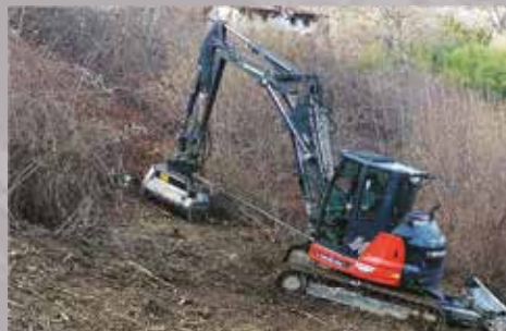
FRESA PER ROVI