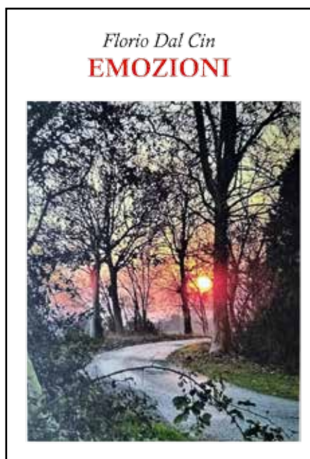
Emozioni, il nuovo libro di Florio Dal Cin